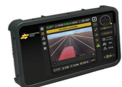
БЛОК УПРАВЛЕНИЯ НА БАЗЕ NVIDIA С ДИСПЛЕЕМ