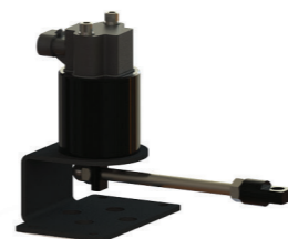
ДАТЧИК УГЛА ПОВОРОТА КОЛЕС