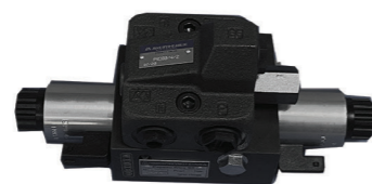
ЭЛЕКТРОННЫЙ ГИДРОБЛОК РУЛЕНИЯ